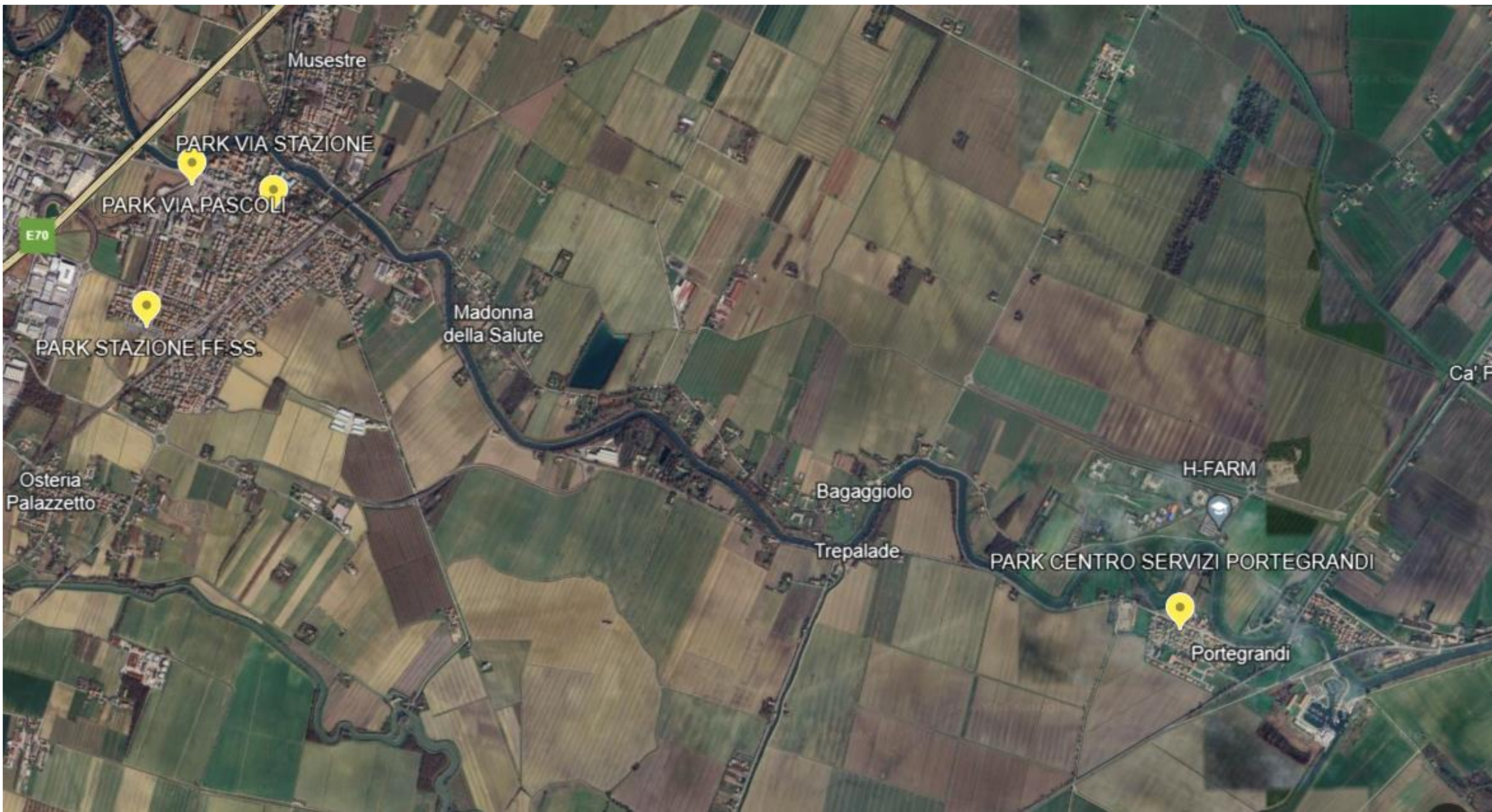
MAPPA INTERO TERRITORIO COMUNALE CON POISIZONAMENTO PUNTI DI RICARICA